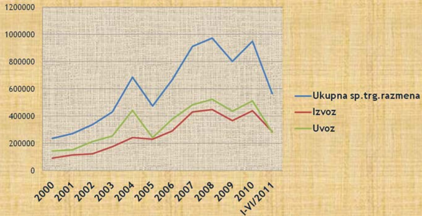
Spoljnotrgovinska razmena na području RPK Niš za period 2000-2011.